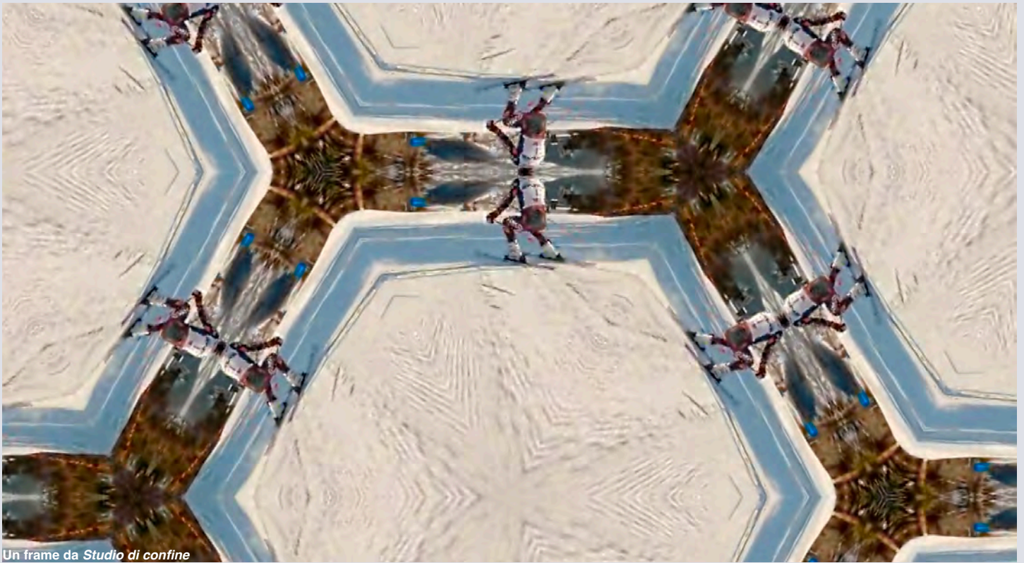
Un frame da Studio di confine